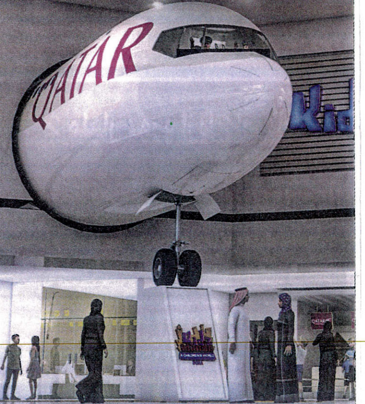
مجسم جناح القطرية في المدينة التفاعلية