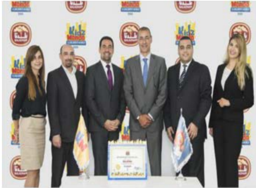
الهيئة التنفيذية لمندو كيدز موندو وشركة بلدنا