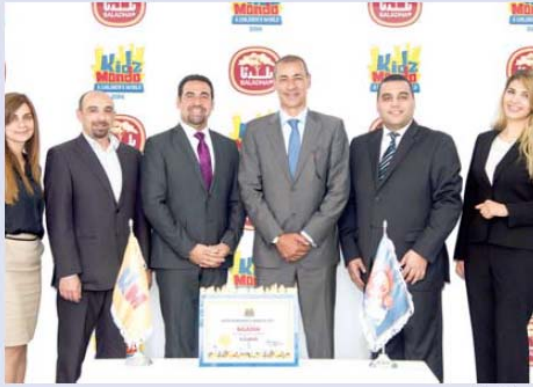
● صورة جماعية

له أن يشارك الأطفال في مراحل الإنتاج والتعبئة والتغليف للعديد من منتجات الألبان مما يفتح أمامهم باب المعرفة بأحدى الصناعات المهمة القائمة. وتضم مبيعة كيدز موندو في قطر بعض من القطاعات الرئيسية التي تتمثل في شركة طيران، محطة إطفاء، ومركز شرطة، ومستشفى، وسعد لتعليم قيادة السيارة، ومضمار سباق، وجامعة، ومحطة لغسيل السيارات، ومحلل لتصنيف الشعر، وقناة تلفزيون، ومحطة راديو، ومصفاة للنفط والغاز، ومنشآت أخرى عديدة. تقع كيدز موندو الدوحة في «مول قطر» الأكبر في العولة، وتمتد على مساحة تصل إلى نحو 8000 متر مربع. ستستضيف المدينة أكثر من 60 مؤسسة فريدة من نوعها، وأكثر من 80 نشاطاً، وتسمى لتعزو أحد أوجه ترفيه الأكثر شعبية داخل دولة قطر.