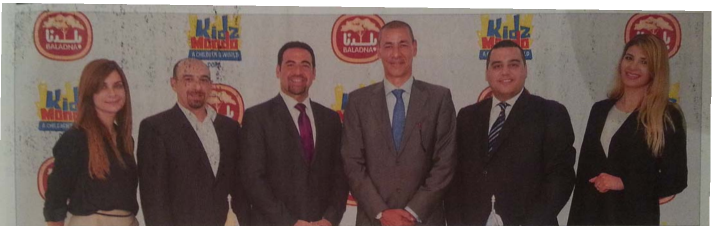
KidzMondo Doha has partnered with Baladna to add a dairy factory to the indoor theme park.