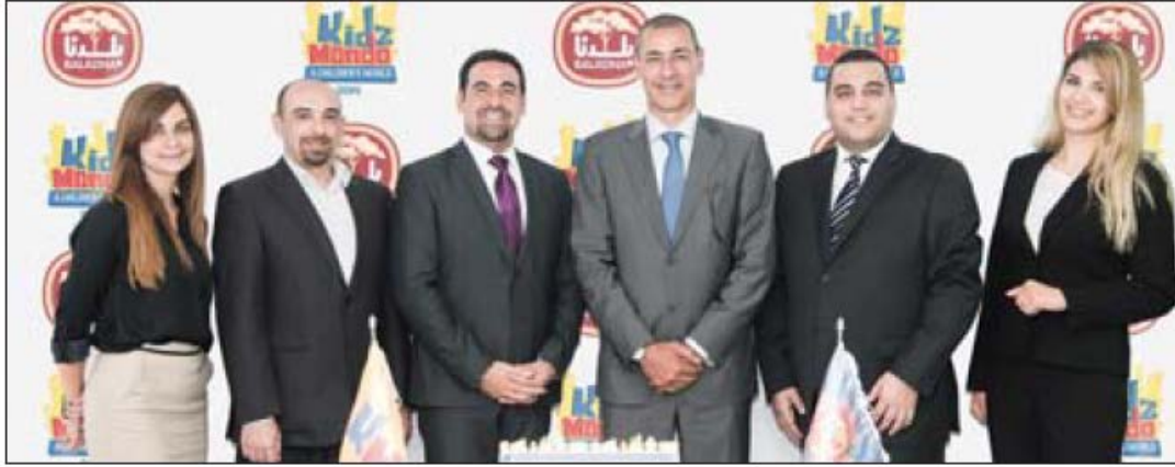
□ لقطة جماعية لمسؤولي كيدز موندو وشركة بلدنا

إضافة مصنع للألبان ضمن نشاطات المدينة الترفيهية